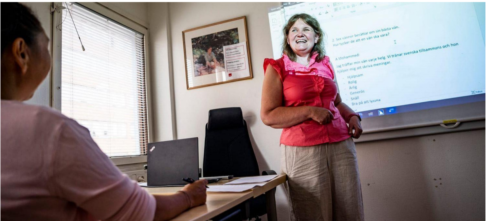
Med envishet och hjälpmedel gör hon nu sitt elfte år som lärare.

– Fint, men här står det "vilka år" i stället för "vilket år", rättar hon.