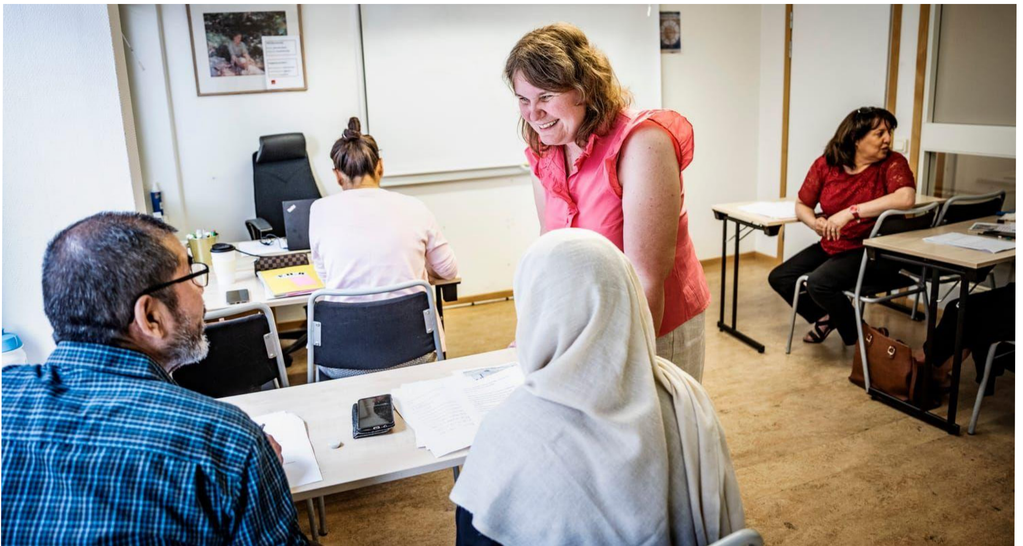
Annikas dröm har alltid varit att bli lärare. Hon ville gärna undervisa och brann för ämnen som svenska och psykologi. Men ingen uppmuntrade henne.